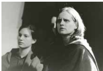
Szenenfoto „kleine bühne“ der vhs. Euripides: Die Troerinnen

Für das Frühjahr 2012 plant die „kleine bühne“ der vhs außerdem die Aufführung eines Stückes von Thomas Bernhard („Am Ziel“)